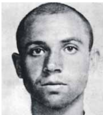
Miguel Hernández será homenajeado en la explanada del Metro que lleva su nombre.

Miguel Hernández: "Homenaje Poético", con poesía y música junto a la escultura del poeta. Organiza: A.V. Palomeras Sureste.