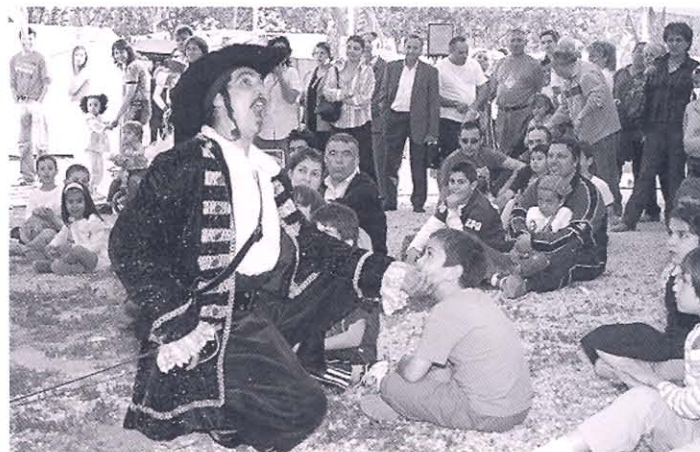
En la foto una escena de teatro en la calle en la edición de 2006

Para más información así como para bajarse el formulario de participación, se puede consultar la página www.vallecasalledelibro.org , o la pestaña correspondiente de la página web www.vallecastodocultura.org